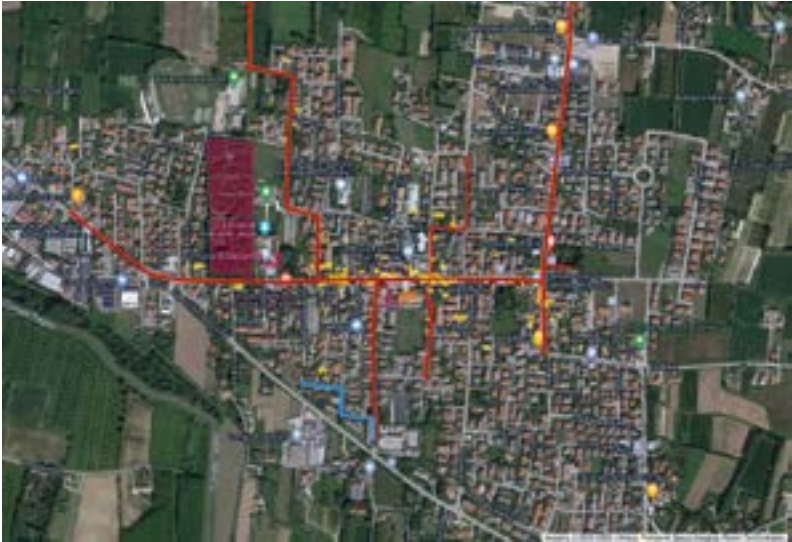
Mappa di Salzano creata dagli studenti