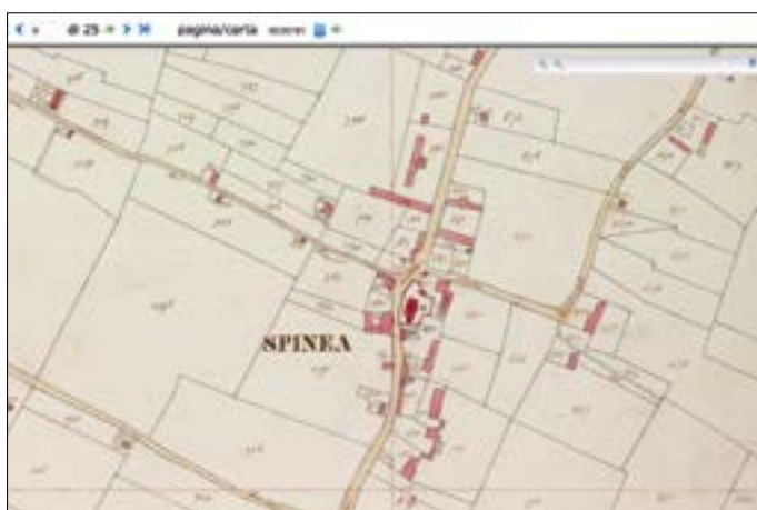
Due esempi di mappa