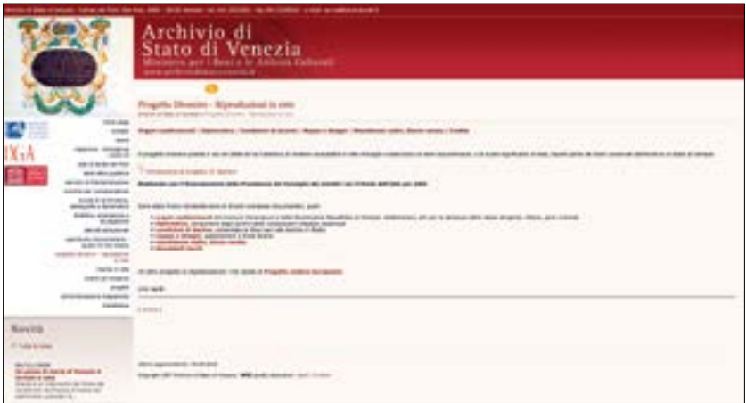
Homepage del progetto Divenire sul portale http://www.archiviodistatovenezia.it/web/

La possibilità di accedere da remoto alle mappe del Censo stabile austriaco ha permesso, presso l'IIS Levi-Ponti, di strutturare il laboratorio di storia in tempi rapidi (2 ore di formazione per i docenti e 4 ore di lavoro in ogni classe) e di sfruttare agilmente la Lavagna Interattiva Multimediale (LIM) per le lezioni propedeutiche, incentrate sulla storia dei catasti antichi e l'utilizzo del software Divenire . Al di là di qualche difficoltà, talvolta, ad aprire le immagini caricate sul sito dell'Archivio di Stato di Venezia, gli studenti hanno potuto consultare le fonti online individualmente o in piccoli gruppi, non esclusivamente in relazione al territorio di Mirano, ma anche di altre comunità dell'attuale provincia di Venezia. La spinta a studiare la cartografia antica della propria comunità di provenienza, comparata alle immagini satelli-