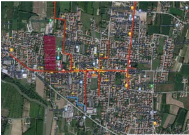
Mappa di Paluello creata dagli studenti

Nella mappa austriaca di Paluello si possono notare numerose differenze rispetto alla carta dei giorni nostri: quasi tutte le vie attuali si chiamavano diversamente in passato e la strada principale, che oggi attraversa il paese, nell'800 non esisteva nemmeno, mentre nella zona sud si trovava la Strada Consorziale detta dei Bruseganelli, oggi scomparsa. Nel passato la maggior parte delle poche abitazioni si concentrava a sud della Strada Comunale detta dell'Argine, ed anche oggi il paese si sviluppa soprattutto a sud della stessa strada che ha assunto altri nomi.