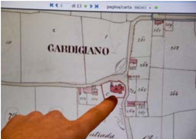
La ricerca delle mappe

Per facilitare il riconoscimento dei luoghi si è poi suggerita una strategia rivelatasi molto efficace: ogni coppia ha aperto su di uno schermo la mappa catastale individuata e in quello accanto Google Maps con le foto aeree. Zoomando le due mappe con un ingrandimento simile, era dunque possibile accostare la mappa ottocentesca alle foto che rappresentano l'aspetto attuale dello stesso luogo, consentendo così di sviluppare più agevolmente un confronto.