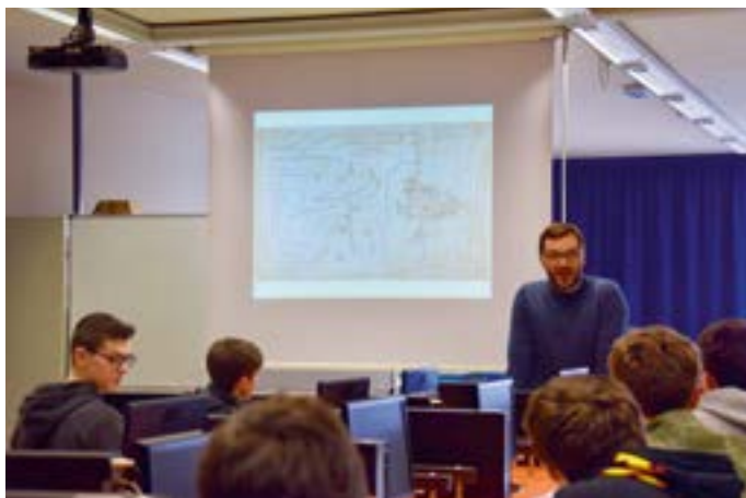
La lezione introduttiva

In questo quadro la creazione dei catasti costituì un salto di qualità decisivo per l'efficacia del prelievo fiscale: si passò dalla dichiarazione giurata del contribuente, chiamato ad "autocertificare" i suoi possedimenti, alla rigorosa misurazione e registrazione dei beni immobili, indizio di uno Stato che andava strutturandosi in chiave moderna.